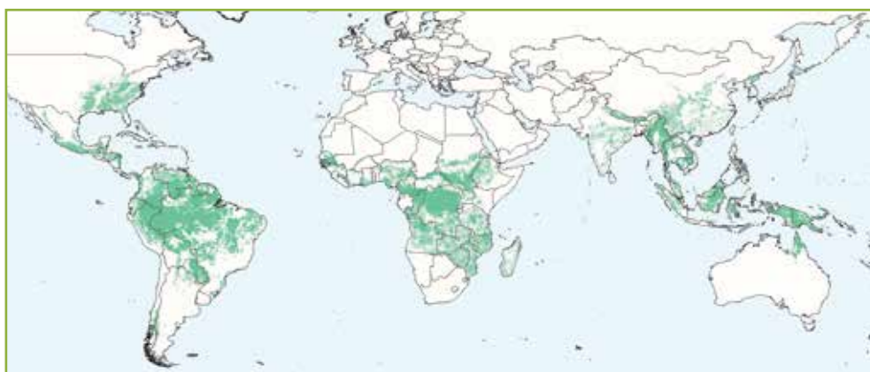
Posible distribución del bambú dentro de la cubierta forestal existente.