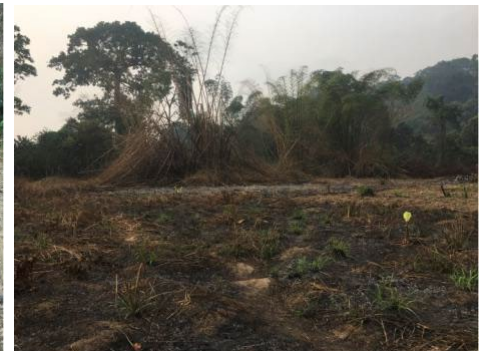
Défrichement de la forêt dans la Reserve de Faune du Lac Ossa