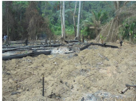
Défrichement de la forêt à Ngog Mapubi