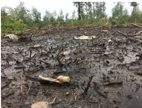
Défrichement des forêts de mangroves dans l'arrondissement de Mouanko